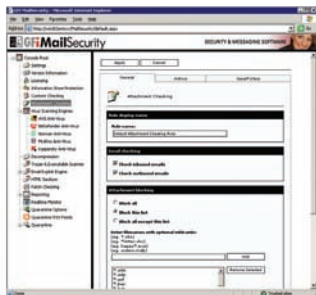
Настройка проверки прикрепленных файлов

Использование нескольких антивирусных механизмов также дает возможность администраторам быть не зависящими от производителя продукта, когда дело касается сканирования вирусов, позволяя использовать лучшие из механизмов, доступных на рынке.