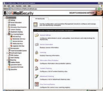
Настройка GFI MailSecurity